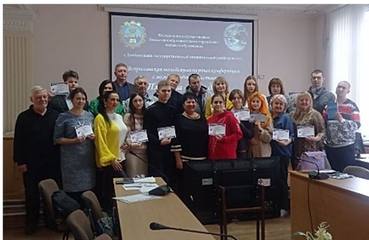
Рисунок 6 — Участники конференции после вручения сертификатов

И, возрождая добрые традиции конференции «Планета — наш дом», клуб самодеятельной песни «Октябрь» подарил всем участникам небольшой концерт бардовской песни (рис. 7).