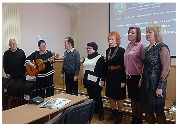
Рисунок 7 — Выступление участников клуба самодеятельной песни «Октябрь»