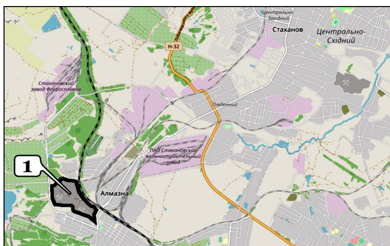
1 – отвал ферросплавного шлака