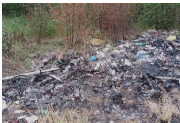
Рисунок 1 Загрязнение природных ресурсов