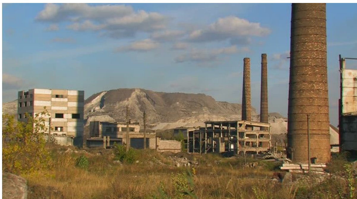
Рисунок 4 Остатки комплекса промышленных сооружений в районе Васильевки