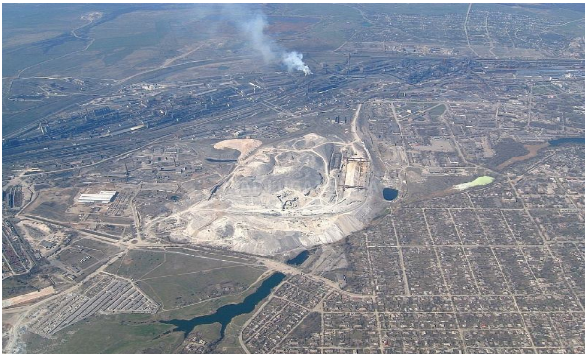
Рисунок 3 Панорама окрестностей шлаковой горы в районе городского кладбища

ность в тесной связи с разборкой зданий или их отдельных элементов с последующими отделочными работами.