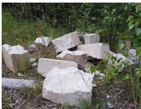
Рисунок 2 Строительный мусор

Анализ ситуации показывает, что обычными запретительными мерами ее решение невозможно, так как не налажен самый главный принцип утилизации подобного мусора — его переработка. А отсутствие правильного и эффективного экологического воспитания или формализм в этом направлении не дает каких-либо значимых результатов.