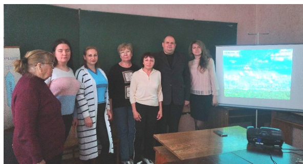
Рисунок 4 Участники круглого стола «Экологические проблемы городской среды» от ДонГТИ

Все выступающие подчеркивали важность экологической профессии в современном мире, указывая, что качество специалистов в этой области зависит от правильной постановки и реализации образовательной деятельности. Все сошлись во мнении, что высококлассный специалист-эколог, которому предстоит решать серьезные научно-практические задачи, должен иметь знания не только по своей специальности, но также в сфере природоохранного законодательства и современных IT-технологий.